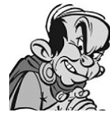
Tullius Detritus « La Zizanie »